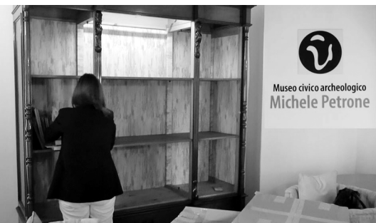
Museo civico archeologico Michele Petrone

«Questo "Armadio della Memoria" è quello che noi siamo stati, quello